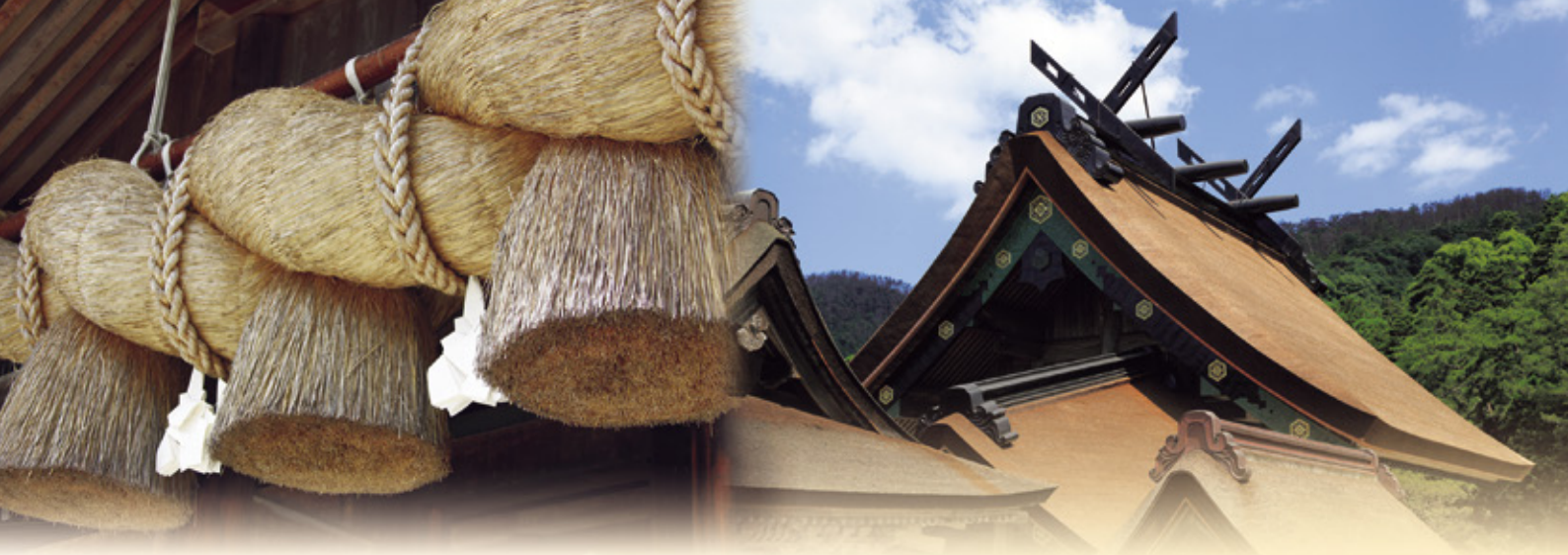
神楽殿の大注連縄